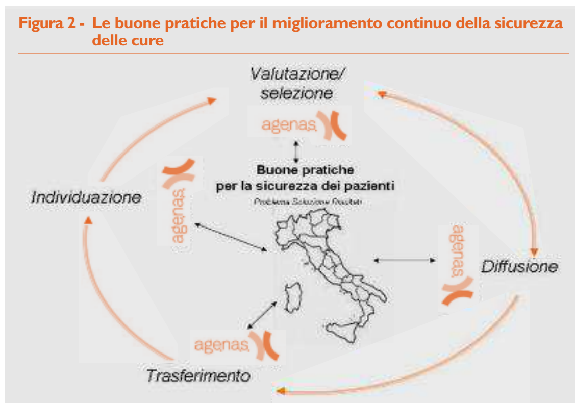
Figura 2 - Le buone pratiche per il miglioramento continuo della sicurezza delle cure

I risultati dell'esperienza call for good practice verranno presentati in un workshop che si svolgerà a Roma l'8 ottobre 2008. Il workshop, organizzato in collaborazione con il ministero del Lavoro, della Salute e delle Politiche Sociali, prevede una sessione dedicata alle buone pratiche in ambito internazionale e una tavola rotonda sul panorama nazionale delle buone pratiche, a cui parteciperanno le principali autorità nazionali in materia sanitaria.